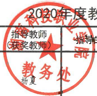
2020年度教师(含教师指导学生)参加其它竞赛获奖奖金统计汇总表