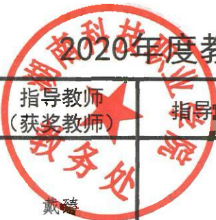
2020年度教师(含教师指导学生)参加其它竞赛获奖奖金统计汇总表