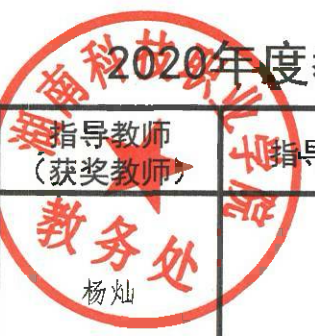
2020年度教师(含教师指导学生)参加其它竞赛获奖奖金统计汇总表