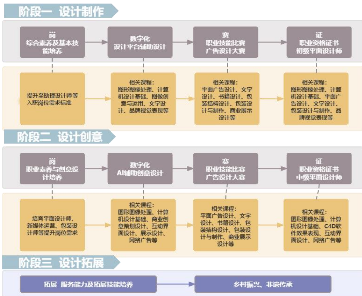
图 1 岗课赛证对应图