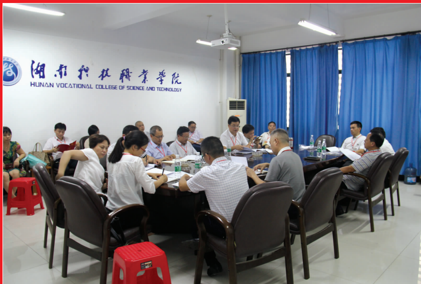
第三小组在讨论纪委工作报告