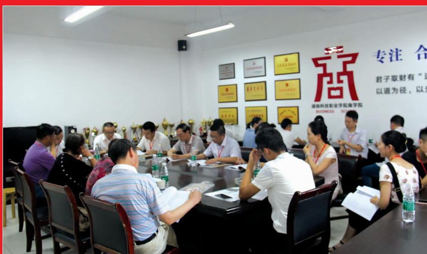
第四小组在讨论新一届两委候选人名单