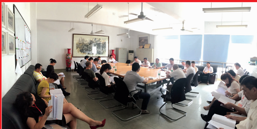
第二小组在审查党费收缴使用情况的报告