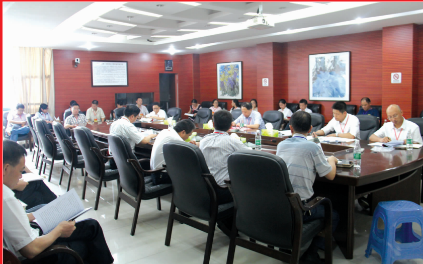
第一小组在热议党委工作报告